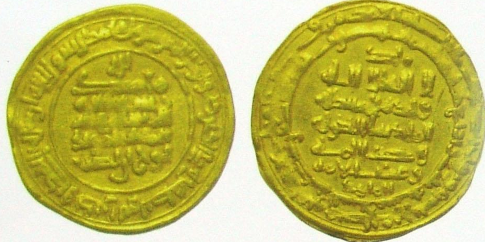
دينار بويهى السنة: ٤٠٢ هجري المدينة: دار السلام الحاكم: بهاء الدولة Bowahiya Dinar Year: 402 H Mint: Dar Al Salam Ruler: Baha Aldawlah